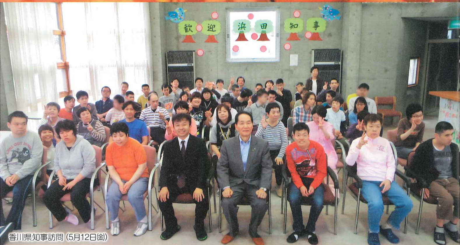
香川県知事訪問 (5月12日(金))

—長尾福祉社会理念— 障害をもっているも 持っていないも 男も女も 「生まれておめでとう・成長しておめでとう・長生きしておめでとう」といえる 社会づくりをめざします。