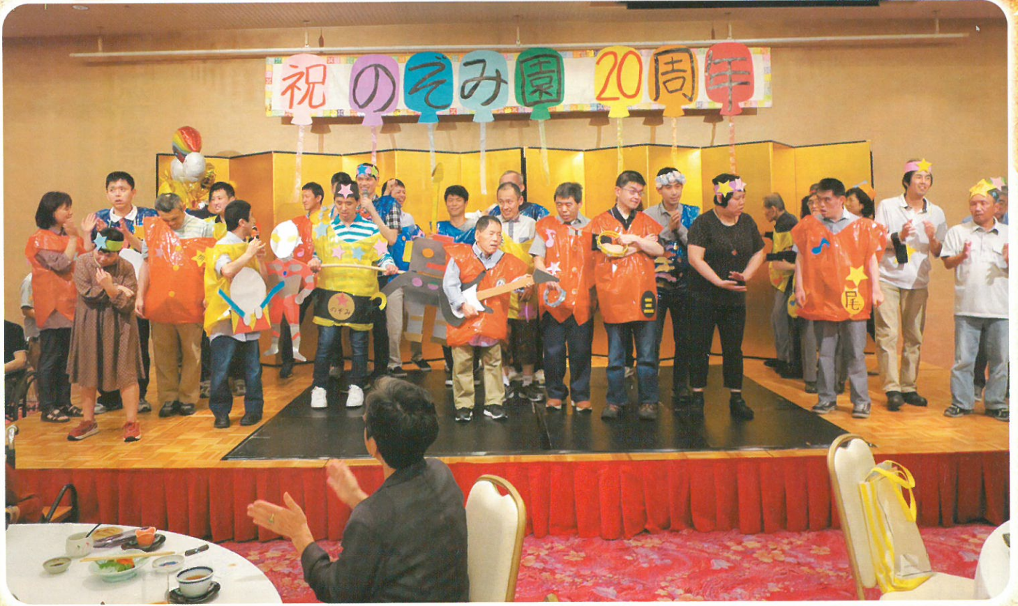
のぞみ園開園20周年記念食事会 (9月6日)