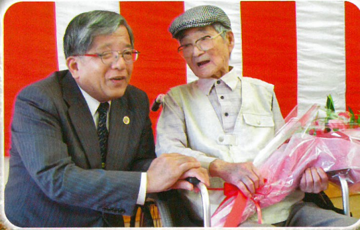
ゆたか荘 敬老会&家族会

—長尾福社会理念— 障害をもっているも もっていないも 男も女も 「生まれておめでとう・成長しておめでとう・長生きしておめでとう」といえる 社会づくりをめざします。