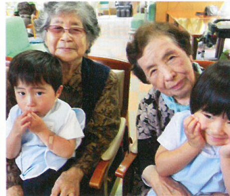
聖母幼稚園児訪問