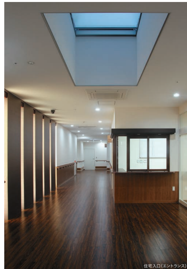
住宅入口(エントランス)

介護・医療と連携して高齢者を支援するサービスを提供する、バリアフリー構造などを備えた賃貸住宅です。