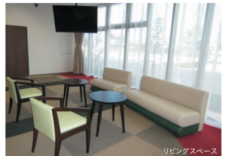
リビングスペース