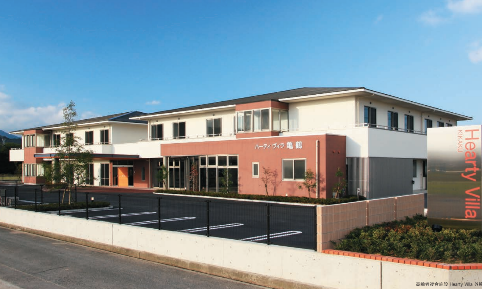
高齢者複合施設 Hearty Villa 外観